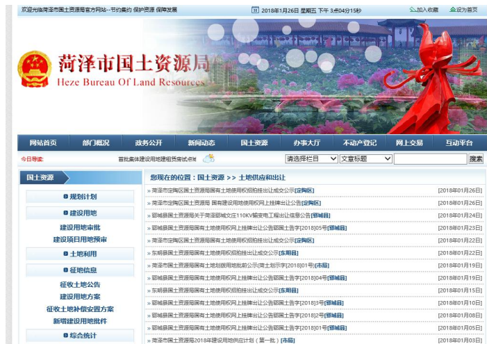
(土地供应和征地信息)

18. 围绕防范遏制重特大生产安全事故推进公开。及时发布事故信息和安全警示提示信息。加大安全生产监管执法检查信息公开力度，公开常规检查执法、暗查暗访、突击检查、随机抽查等执法检查信息。