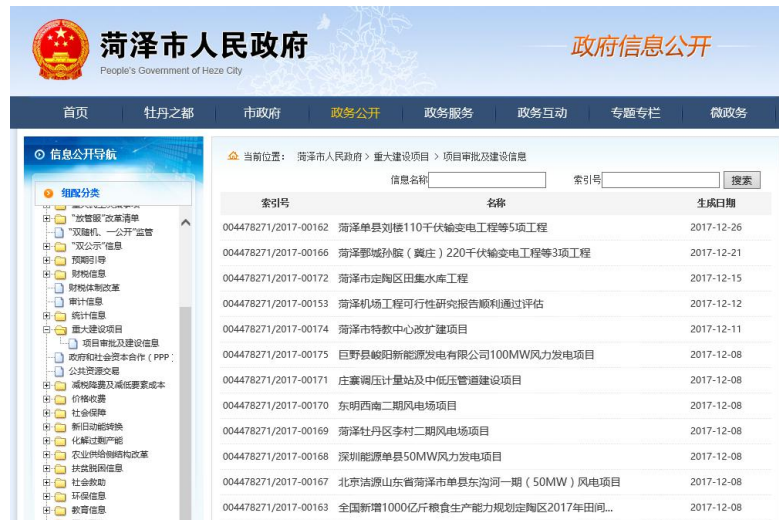
(项目审批及建设信息)

鲁南高铁等重大项目的进展情况。市政府网站和市财政局网站公开了全市 PPP 项目的政府和社会资本参与方式、项目合同和回报机制、项目实施情况等内容。